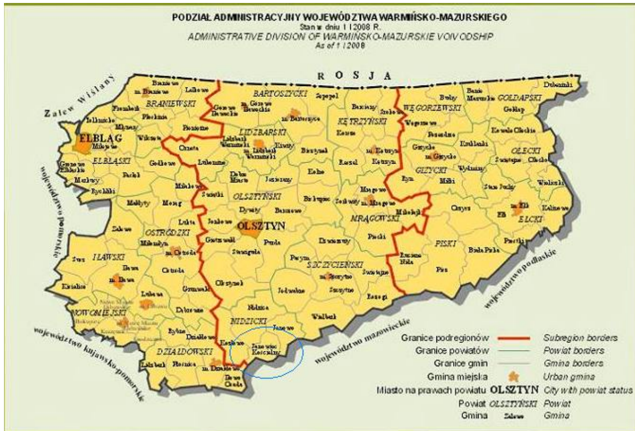
Rys. 2. Umiejscowienie Gminy Janowiec Kościelny na terenie woj. warmińsko-mazurskiego