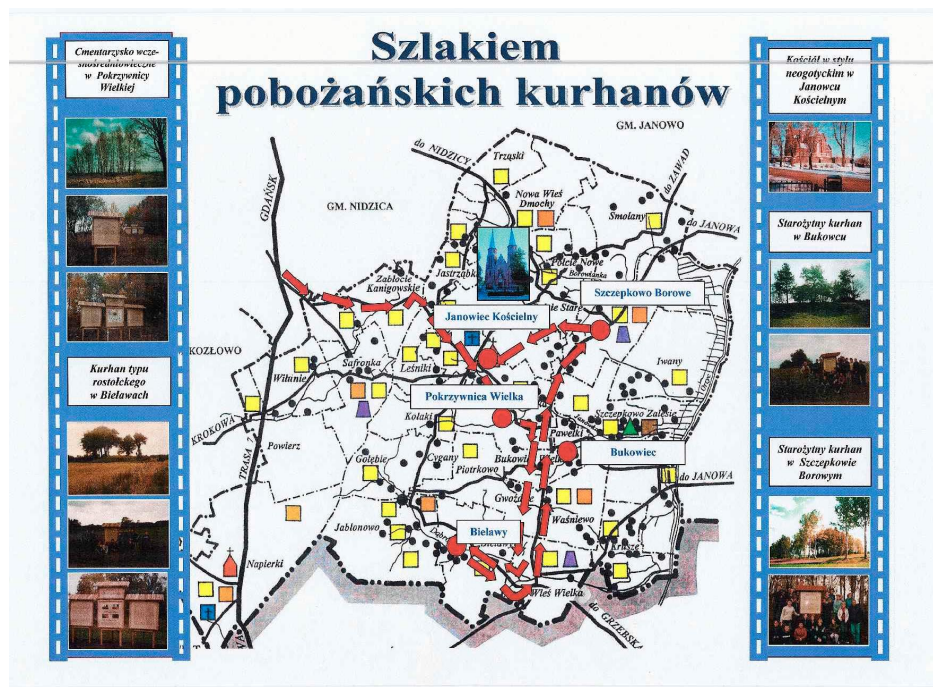
Rysunek nr 4. Zabytki archeologiczne na terenie gminy