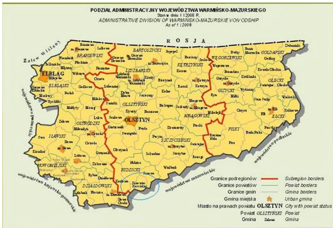
Rysunek nr 2. Umiejscowienie Gminy Janowiec Kościelny na terenie woj. warmińsko-mazurskiego

Na poniższej mapie zaprezentowano umiejscowienie całej Gminy na terenie woj. warmińsko-mazurskiego w układzie administracyjnym.