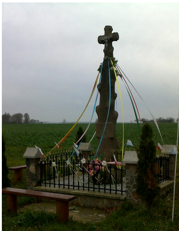
Rysunek 4: Figiurka przydrożna w msc. Waśniewo-Gwoździe