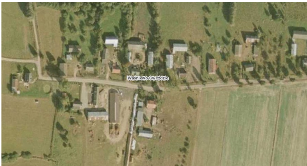
Rysunek 3: Waśniewo-Gwoździe

Miejscowość Waśniewo-Gwoździe posiada typ zabudowy zagrodowej zwartej, w której przeważają domy jednorodzinne. Zabudowa parterowa i jednopiętrowa, dachy strome, dwuspadowe.