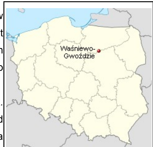
Rysunek 1: Położenie miejscowości na mapie Polski

Waśniewo-Gwoździe znajduje się w odległości ok. km od siedziby gminy (Janowiec Kościelny), ok.20 km od siedziby powiatu (Nidzica) oraz ok. 75 km od Olsztyna (miasto wojewódzkie).