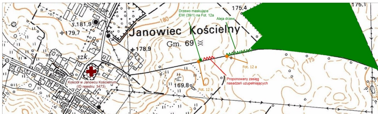
Rys. 10 Proponowany zakres nasadzeń uzupełniających drzewami liściastymi (kolor czerwony) wzdłuż drogi Janowiec Kościelny – Iwany