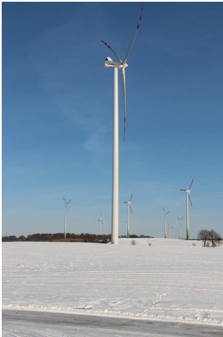
Rys. 1 Elektrownia wiatrowa typu Vestas V90 – 2 MW, w tle elektrownie firmy Enercon (Lisewo, gm. Gniewino)