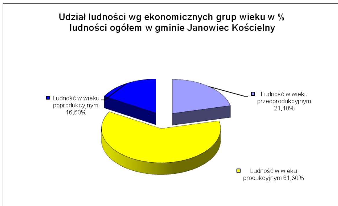
WYKRES NR 1 Udział ludności wg ekonomicznych grup wieku w % ludności ogółem.

W gminie Janowiec Kościelny wg GUS na dzień 31 XII 2010 było zameldowanych 3 379 osób w tym 1 726 mężczyzn oraz 1 650 kobiet. Ludność w wieku przedprodukcyjnym stanowi 22,1% ogółu ludności gminy Janowiec Kościelny. Ludność w wieku produkcyjnym stanowi 61,3 % ogółu ludności gminy. W wieku poprodukcyjnym znajduje się 16,6 % ludności gminy. Graficznym obrazem tej sytuacji jest poniższy wykres.