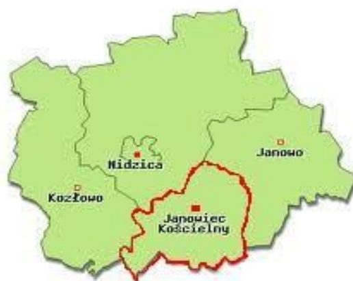
RYСУNEK NR 1 Położenie gminy Janowiec Kościelny na tle powiatu nidzickiego.

Gmina Janowiec Kościelny leży na obszarze Niżu Środkowoeuropejskiego, na pograniczu dwóch podprovincji: Pojezierza Środkowo-Bałtyckiego i Niziny Północno-mazowieckiej. Pas południowy obszaru gminy to mazoregion Wzniesień Mławskich graniczący od północy z Garbem Lubawskim. Gmina Janowiec Kościelny ma obszar 136,25 km 2 , w tym użytki rolne zajmują 73% zaś użytki leśne to 15% terenu. Gmina stanowi 14,18% powierzchni powiatu nidzickiego. Gmina leży zarówno na południowym skraju powiatu, jak również na południowym obrzeżu województwa olsztyńskiego. Na obszar gminy składa się 30 sołectw.