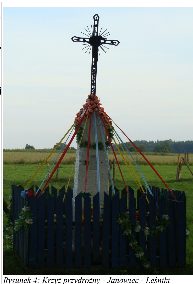
Rysunek 4: Krzyż przydrożny - Janowiec - Leśniki