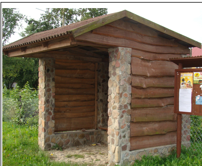
Rysunek 7: Przystanek autobusowy - Janowiec - Leśniki