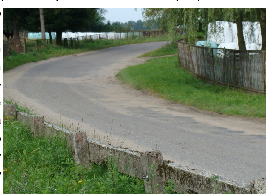
Rysunek 6: Droga powiatowa 1558 N - Janowiec - Leśniki

W miejscowości występują także drogi o znaczeniu lokalnym z nawierzchnią żwirową. Wiele do życzenia pozostawia jednak ich stan techniczny. Z powodu braku środków finansowych a co się z tym wiąże zmniejszenia zakresu robót na drogach ich stan w dalszym ciągu ulega pogorszeniu. Wszystkie drogi w gminie nie są także przygotowane do przyjęcia znacznie większego natężenia ruchu, a w szczególności samochodów ciężarowych.