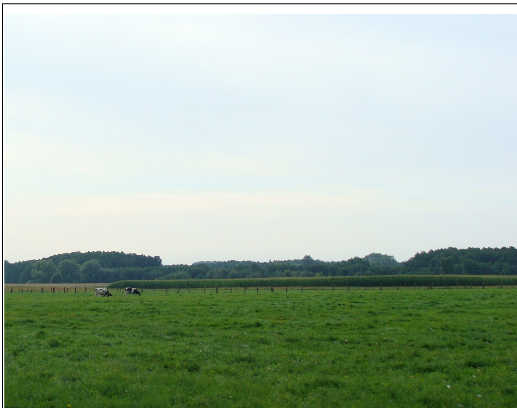
Rysunek 5: Krajobraz miejscowości