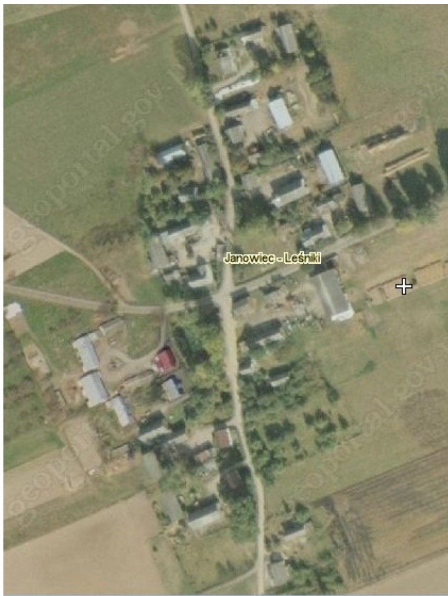
Rysunek 3: Miejscowość Janowiec-Leśniki

Miejscowość Janowiec-Leśniki posiada typ zabudowy zagrodowej zwartej, w której przeważają domy jednorodzinne. Zabudowa parterowa i jednopiętrowa, dachy strome, dwuspadowe.