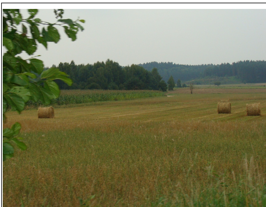
Rysunek 10: Krajobraz miejscowości Połcie Młode

Gleby na terenie miejscowości wykorzystywane są przede wszystkim dla celów rolniczych. Niezależnie od formy gospodarowania gleba stanowi tu podstawowy warsztat produkcji zbożowej, owocowej, paszowej lub drzewnej.