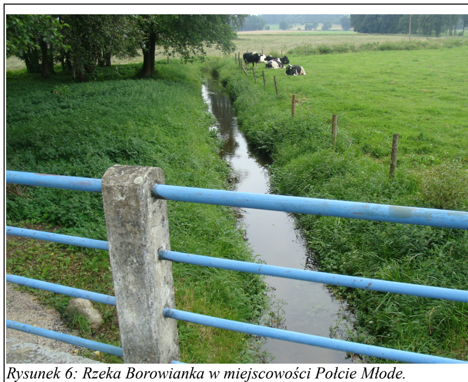
Rysunek 6: Rzeka Borowianka w miejscowości Połcie Młode.