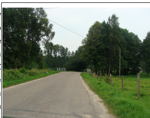
Rysunek 9: Droga powiatowa w miejscowości Połcie Młode

W całej gminie Janowiec Kościelny sieć drogowa jest dobrze rozwinięta, do prawie każdej miejscowości w gminie prowadzi po kilka dróg. Wiele do życzenia pozostawia jednak ich stan techniczny. Z powodu braku środków finansowych a co się z tym wiąże zmniejszenia zakresu robót na drogach ich stan w dalszym ciągu ulega pogorszeniu. Wszystkie drogi w gminie nie są także przygotowane do przyjęcia znacznie