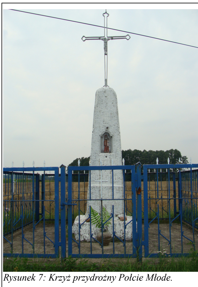
Rysunek 7: Krzyż przydrożny Polcie Młode.