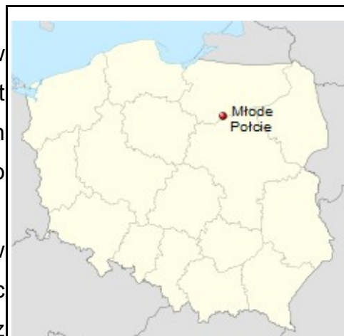
Rysunek 1: Położenie miejscowości na mapie Polski.

Miejscowość Połcie Młode znajduje się w odległości ok. 4 km od siedziby gminy (Janowiec Kościelny), ok. 12 km od siedziby powiatu (Nidzica) oraz ok. 69 km od Olsztyna (miasto wojewódzkie).