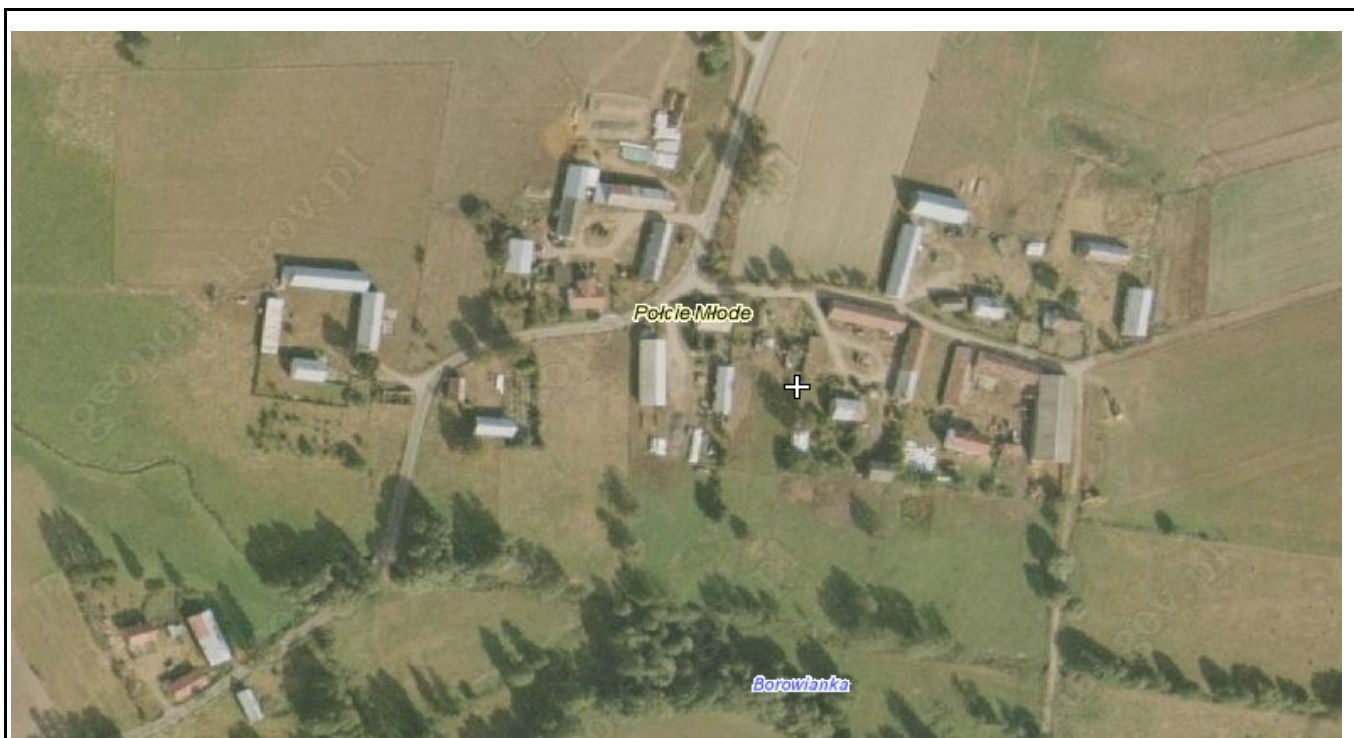
Rysunek 4: Zabudowa wsi Polcie Młode.