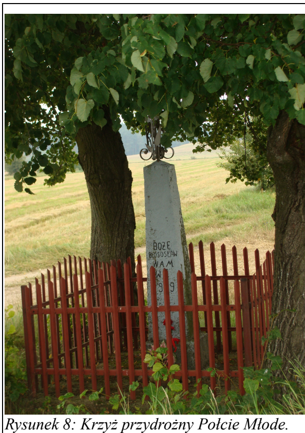
Rysunek 8: Krzyż przydrożny Polcie Młode.