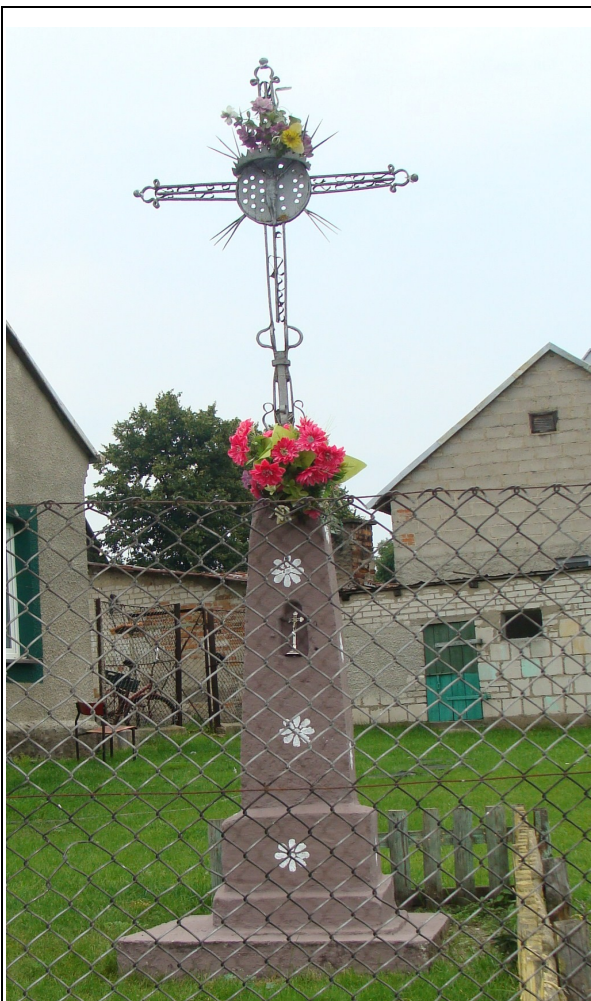
Rysunek 6: Krzyż przydrożny - Smolany-Żardawy