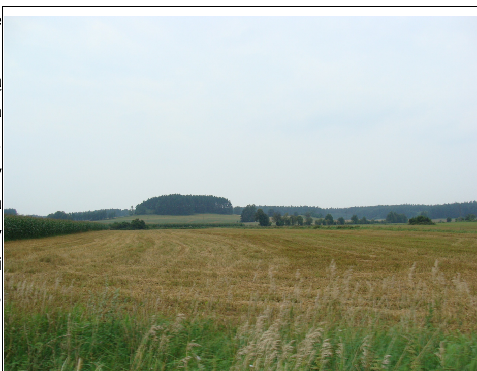
Rysunek 11: Pola uprawne w miejscowości Smolany-Żardawy

Gleby na terenie miejscowości wykorzystywane są przede wszystkim dla celów rolniczych. Niezależnie od formy gospodarowania gleba stanowi tu podstawowy warsztat produkcji zbożowej, owocowej, paszowej lub drzewnej.