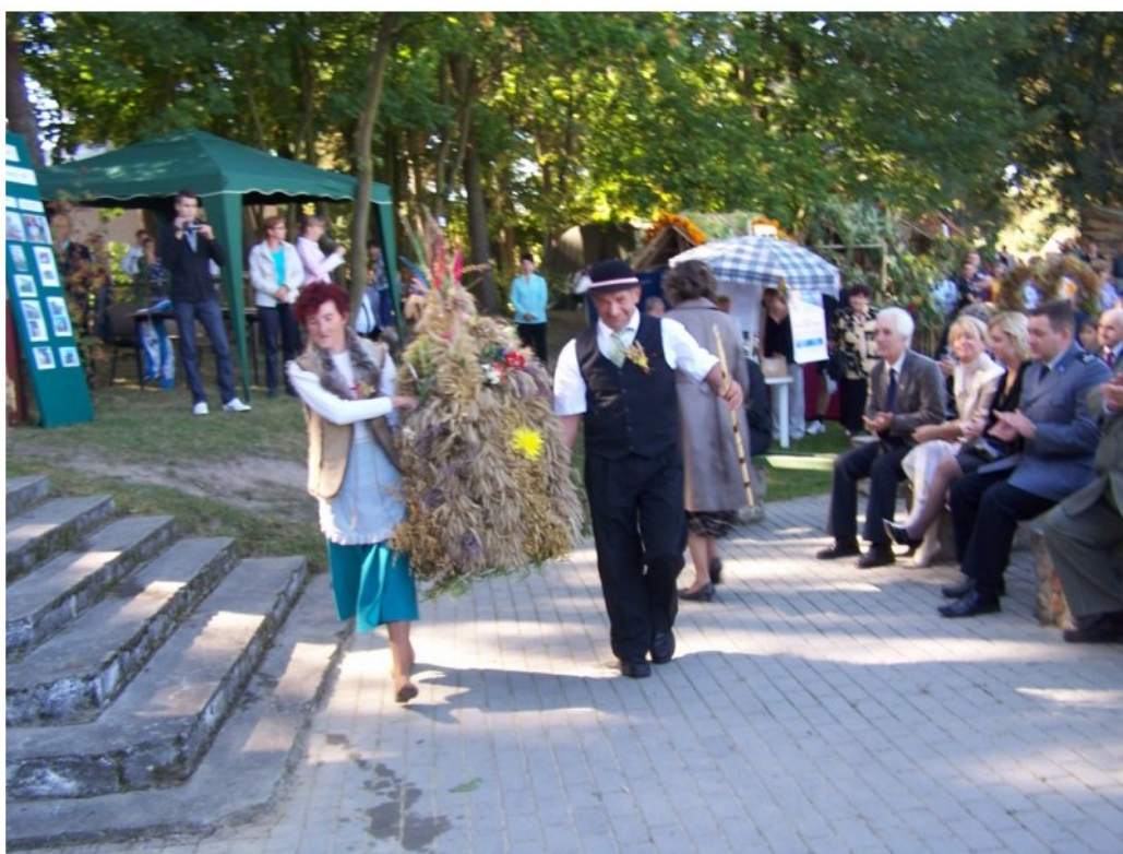
Rysunek 12: Wieniec dożynkowy sołectwa Smolany-Żardawy

wieńce i stoiska dożynkowe – aktywnie uczestniczą w organizacji „Gminnego Święta Pieczonego Ziemniaka”.