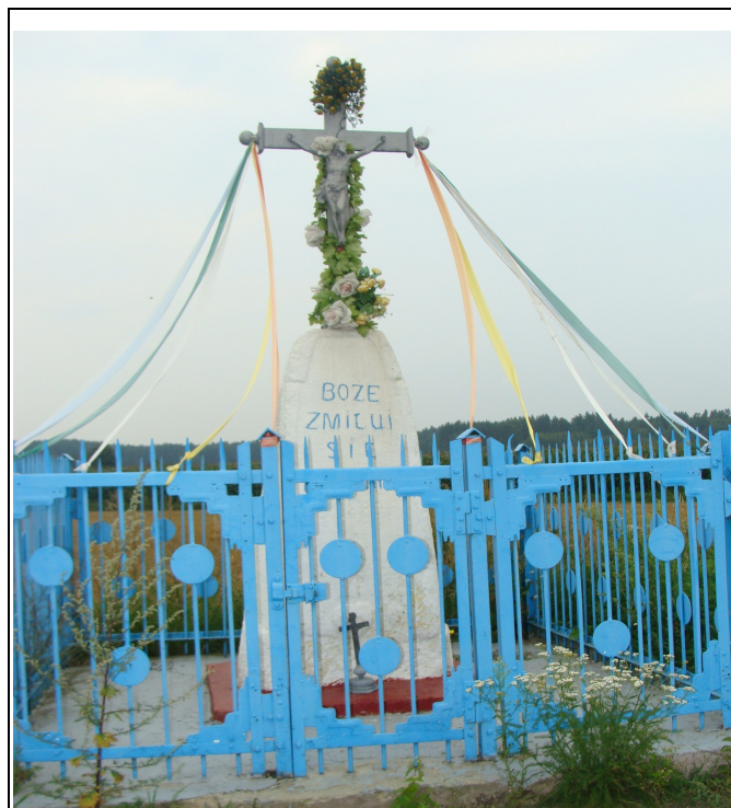
Rysunek 7: Krzyż przydrożny - Smolany-Żardawy

We wsi Smolany-Żardawy znajduje się największy w gminie kurhan - miejsce pochówku oraz zabytkowy mur z kamienia polnego ze średniowiecza: