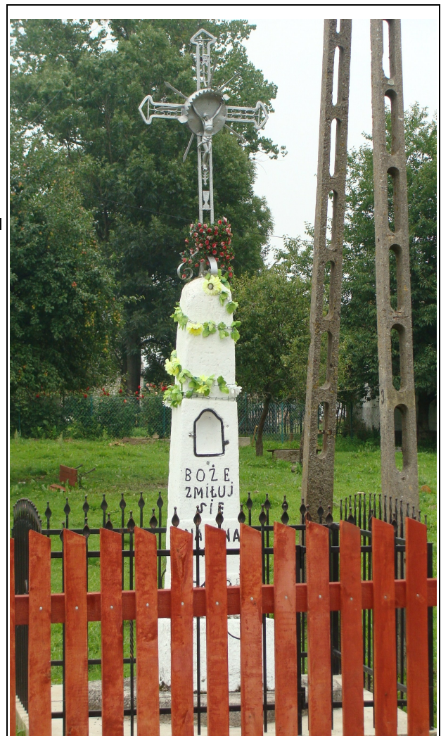
Rysunek 5: Krzyż przydrożny - Smolany-Żardawy