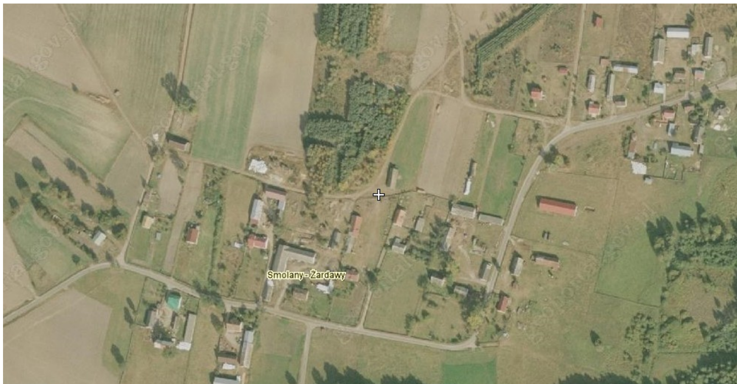
Rysunek 3: Miejscowość Smolany-Żardawy

Miejscowość Smolany-Żardawy posiada typ zabudowy zagrodowej zwartej, w której przeważają domy jednorodzinne. Zabudowa parterowa i jednopiętrowa, dachy strome, dwuspadowe.