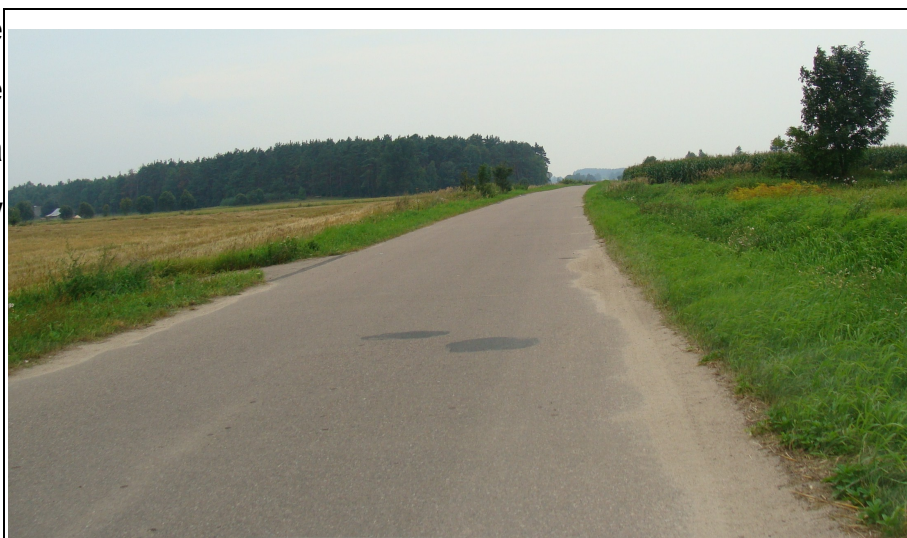
Rysunek 10: Droga powiatowa 1617 N w miejscowości Smolany-Żardawy

W miejscowości występują także drogi o znaczeniu lokalnym z nawierzchnią żwirową. Wiele do życzenia pozostawia jednak ich stan techniczny. Z powodu braku środków finansowych a co się z tym wiąże zmniejszenia zakresu robót na drogach ich stan w dalszym ciągu ulega pogorszeniu. Wszystkie drogi w gminie nie są także przygotowane do przyjęcia znacznie większego natężenia ruchu, a w szczególności samochodów ciężarowych.