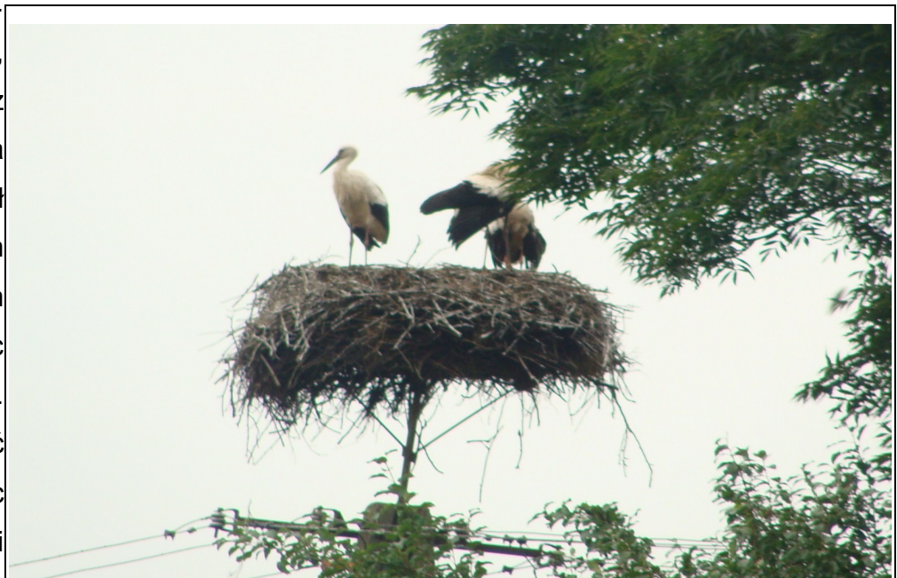
Rysunek 4: Bocian biały - Smolany-Żardawy

Na polach występuje, aczkolwiek coraz rzadziej kuropatwa pospolita, a wokół siedzib ludzkich bardzo licznie bocian biały. Do rzeki Orzyc powróciły bobry. Wschodnia część gminy Janowiec Kościelny od wsi Smolany po Krusze i