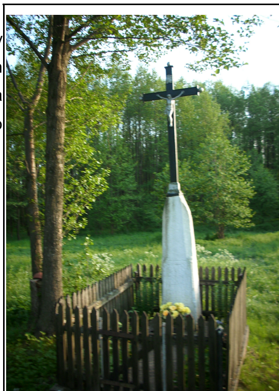
Rysunek 8: Krzyż przydrożny