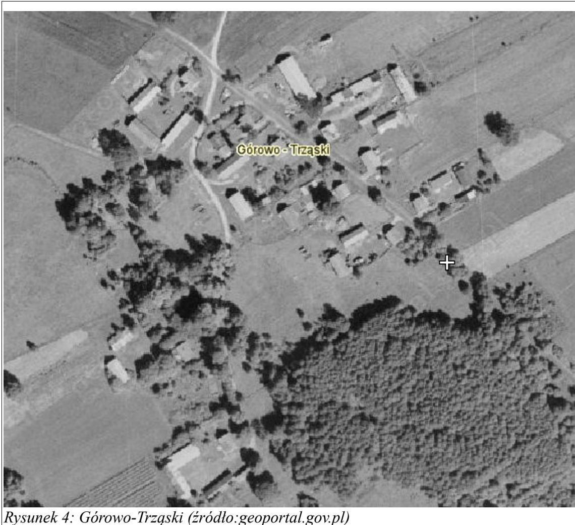
Rysunek 4: Górowo-Trząski

Miejscowość Górowo – Trząski posiada typ zabudowy zagrodowej zwartej, w której przeważają domy jednorodzinne. Zabudowa parterowa i jednopiętrowa, dachy strome, dwuspadowe.