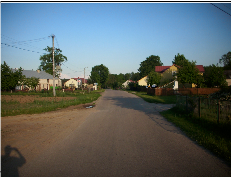
Rysunek 11: Droga powiatowa 1613N

pieszych zmuszonych do korzystania z poboczy. W miejscowości Górowo-Trząski występują także drogi o znaczeniu lokalnym z nawierzchnią żwirową. Wiele do życzenia pozostawia jednak ich stan techniczny. Z powodu braku środków finansowych, a co się z