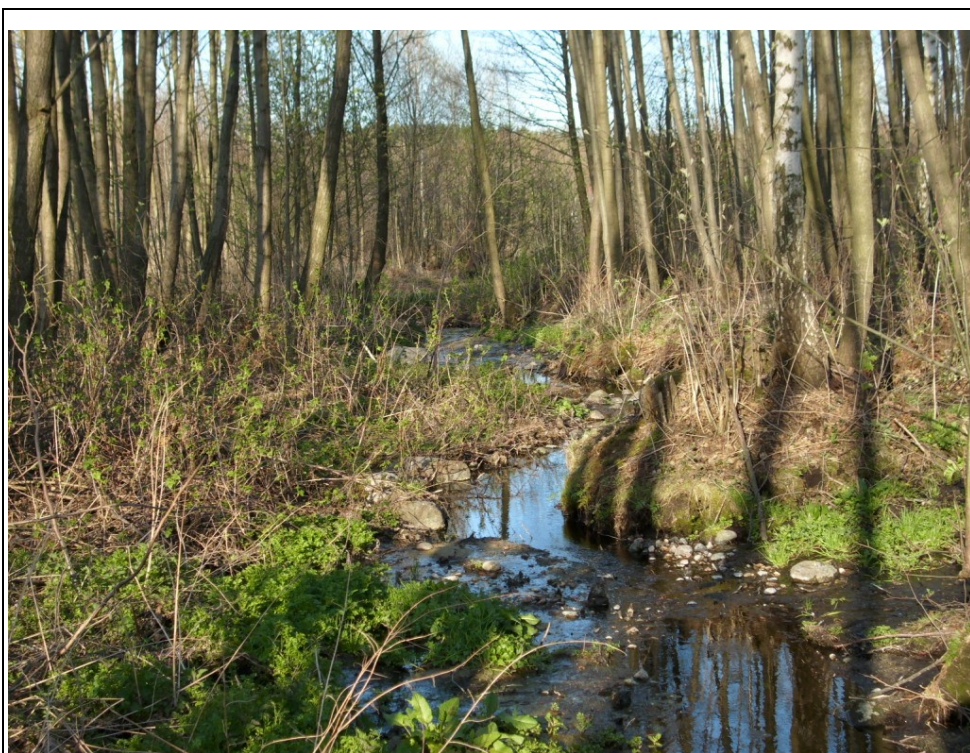
Rysunek 7: Źródła rzeki Borowianka w miejscowości Górowo-Trząski

Źródła cieków położone są na wysokości 180 m n.p.m. na gruntach wsi Górowo-Trząski na południowy-zachód od zabudowy. Zlewnię budują w górnym odcinku gliny zwałowe wzniesień morenowych, w środkowej – piaski z głazami. Dolny odcinek jest podmokły. Dno doliny budują aluwia.