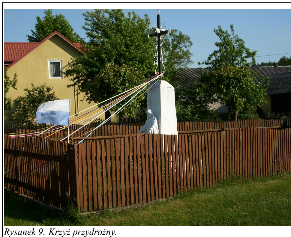
Rysunek 9: Krzyż przydrożny.