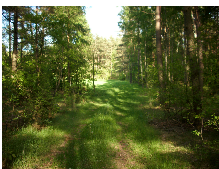
Rysunek 5: Droga leśna w miejscowości Górowo-Trząski

Największą lesistość areалу ma wieś Powierz – 75,59%. Lesistość wsi: Górowo Trząski, Iwany, Leśniewo Wielkie, Nowa Wieś Dmochy, Napierki sięga 25 – 49%. Na terenie pozostałych wsi lesistość jest niższa od średniej dla gminy. 10 wsi jest prawie bezleśnych - od 0 do 3%.