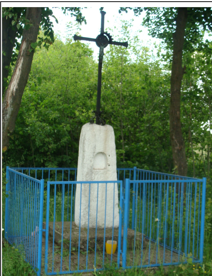
Rysunek 10: Krzyż przydrożny w miejscowości Janowiec-Jastrząbki.