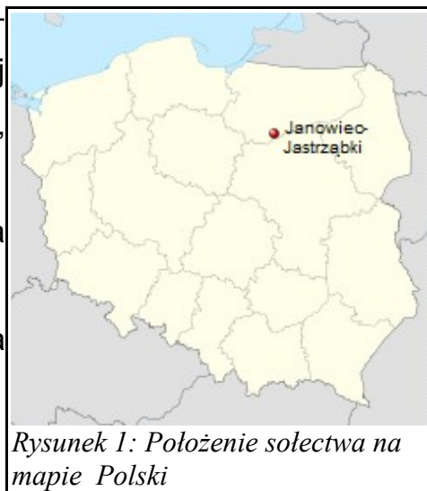
Rysunek 1: Położenie sołectwa na mapie Polski

Położenie sołectwa obrazuje poniższa mapa.