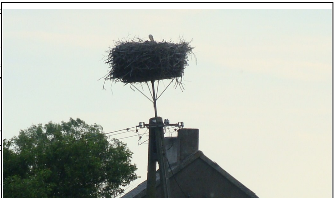
Rysunek 9: Gniazdo bociana białego.

jedną z ważniejszych ostoi w kraju. Ostoja ta obejmuje górną część doliny Orzyca od jej źródeł aż do mostu na szosie Janowo- Mława. Dolina jest zabagniona, zajmują ją zarośla wierzbowe, trzciniowiska i kępy