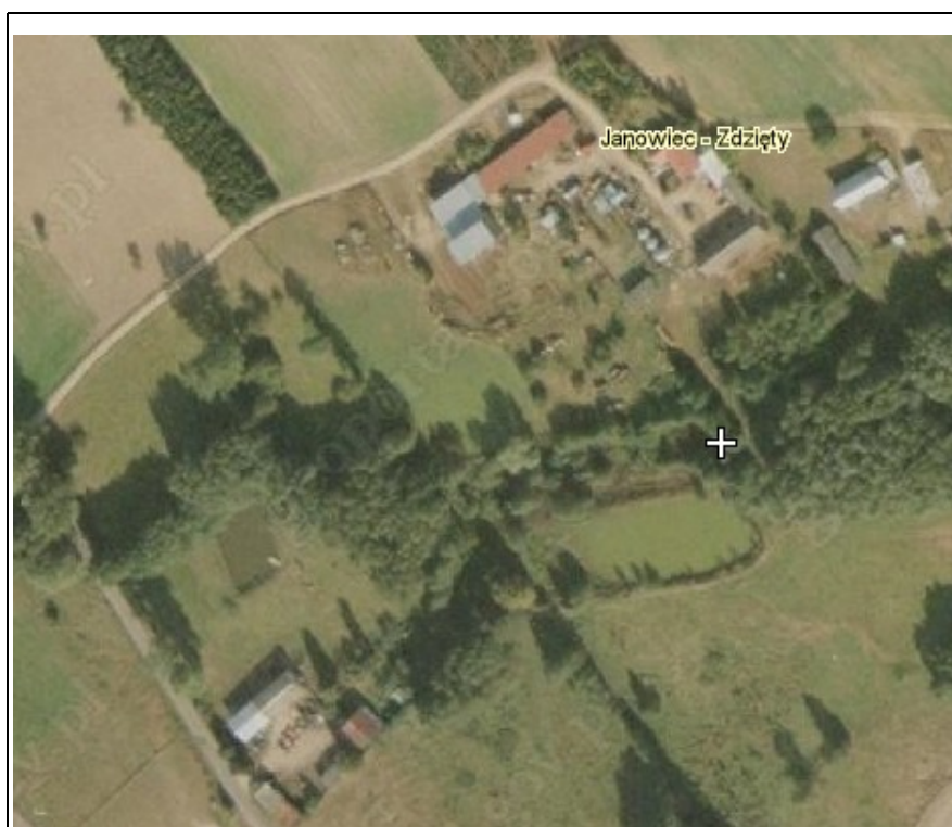
Rysunek 7: Zdjęcie satelitarne zabudowy wsi Janowiec-Zdzięty