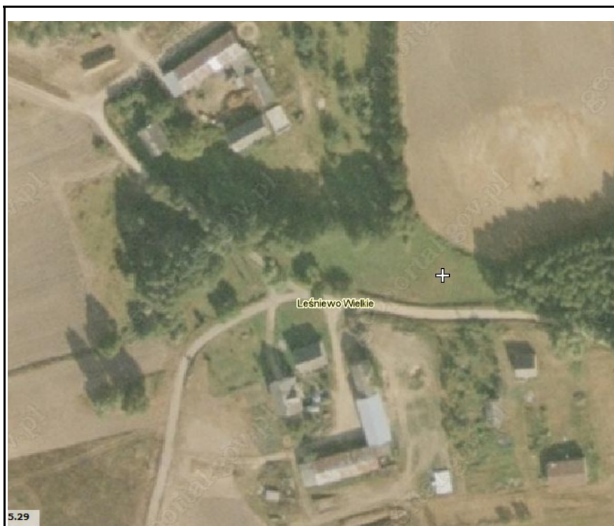
Rysunek 6: Zdjęcie satelitarne zabudowy wsi Leśniewo Wielkie