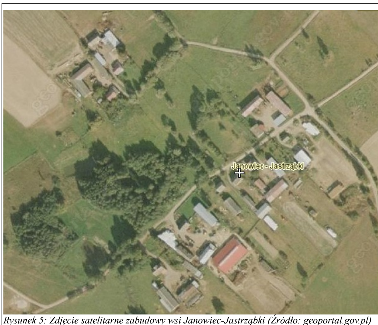
Rysunek 5: Zdjęcie satelitarne zabudowy wsi Janowiec-Jastrząbki

Miejscowości w sołectwie Jastrząbki posiadają typ zabudowy zagrodowej zwartej, w której przeważają domy jednorodzinne. Zabudowa parterowa i jednopiętrowa, dachy strome, dwuspadowe.