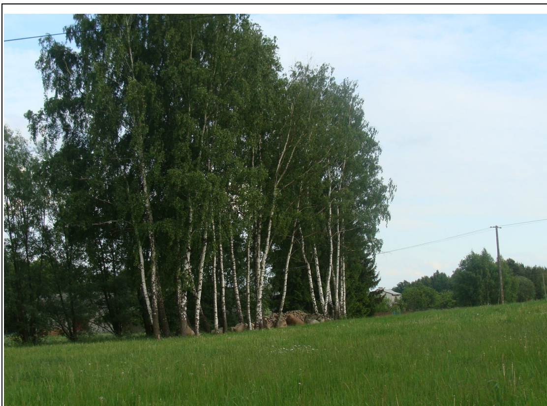
Rysunek 8: Lasy w okolicach miejscowości Leśniewo Wielkie.