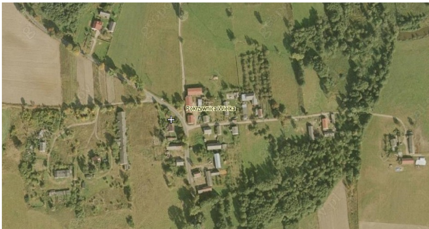
Rysunek 5: Miejscowość Pokrzywnica Wielka

Miejscowość Pokrzywnica Wielka posiada typ zabudowy zagrodowej zwartej, w której przeważają domy jednorodzinne. Zabudowa parterowa i jednopiętrowa, dachy strome, dwuspadowe.