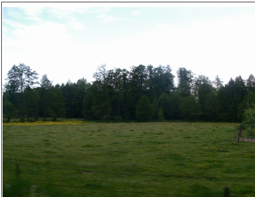
Rysunek 9: Krajobraz miejscowości Pokrzywnica Wielka.