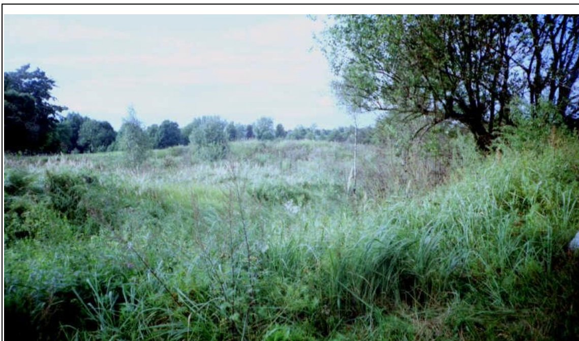
Rysunek 7: Cmentarzysko wczesnośredniowieczne w Pokrzywnicy Wielkiej

Cmentarzysko znajduje się na łagodnym wyniesieniu bezpośrednio na północ od drogi biegnącej z Janowca Kościelnego do drogi Nowa Wieś Wielka - Szczepkowo Borowe. Obiekt porośnięty jest młodym lasem liściastym. W części zachodniej cmentarzyska obecnie znajduje się nie użytkowana żwirownia, która częściowo zniszczyła stanowisko. Spod darni wystają liczne duże głazy – pozostałości po obudowach kamiennych grobów. Teren zajmowany przez cmentarzysko ma w przybliżeniu kształt trapezu, którego dłuższą podstawę stanowi szosa, zaś krótszą krawędź nieużytku. Z informacji przekazanych przez Państwowe Muzeum Archeologiczne w Warszawie wynika, że cmentarzysko szkieletowe w Pokrzywnicy Wielkiej należy do grupy cmentarzysk mazowieckich z grobami w tzw. obudowach kamiennych. Zostało ono odkryte w 1949 roku podczas badań powierzchniowych