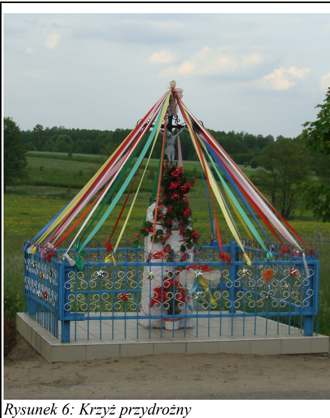
Rysunek 6: Krzyż przydrożny