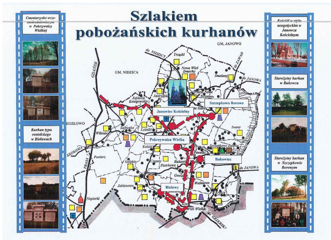
Rysunek 8: Szlak pobożańskich kurhanów.

którego wchodzi znaczna ilość broni, należy przypuszczać, że pochowana społeczność należała do grupy drobnego rycerstwa. Niewykluczone, że niektórzy zmarli to weterani wojen Władysława Hermana, czy Bolesława Krzywoustego. W chwili obecnej cmentarzysko zostało przebadane, a wszystkie zabytki pozyskane w trakcie wykopalisk przechowywane są w Państwowym Muzeum Archeologicznym w Warszawie.