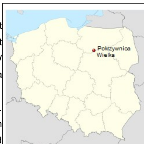
Rysunek 1: Położenie miejscowości na mapie Polski.

Pokrzywnica Wielka znajduje się w odległości ok. 4 km od siedziby gminy (Janowiec Kościelny), ok. 16 km od siedziby powiatu (Nidzica) oraz ok. 70 km od Olsztyna (miasto wojewódzkie).