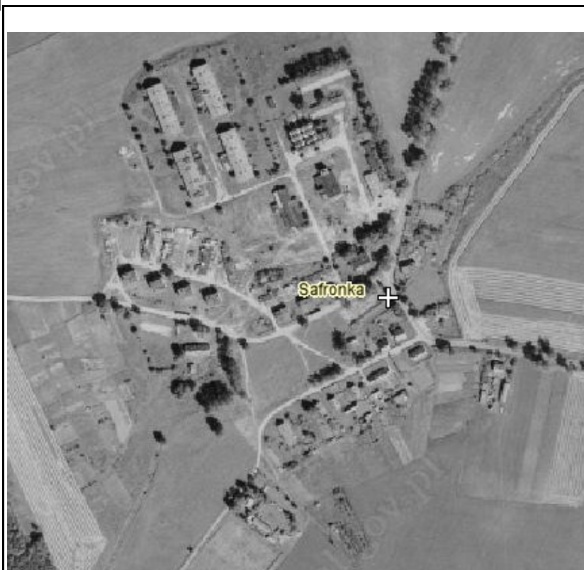
Rysunek 3: Miejscowość Safronka

Miejscowości Safronka i Wiłunie posiadają typ zabudowy zwartej zagrodowej.