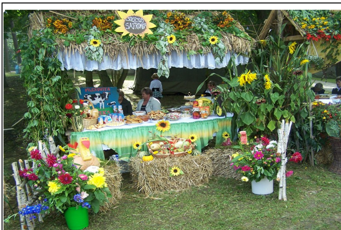
Ilustracja 1: Stoisko dożynkowe Sołectwa Safronka na Gminnym Świącie Piezonego Ziemiaka.

Celem „Planu Odnowy Miejscowości Safronka i Wiłunie” jest próba wzmocnienia więzi międzyludzkich oraz zwiększenie motywacji do wspólnego działania na rzecz poprawy warunków i jakości życia we wsi. Więzy międzyludzkie są słabe, ponieważ brakuje odpowiedniej infrastruktury, która sprzyjałaby integracji.