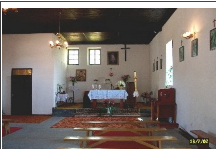
Rysunek 4: Kapliczka w Safronce

oraz Kapliczka. Wokół tych obszarów skupia się praktycznie całe życie miejscowości. W świetlicy wiejskiej funkcjonuje Punkt Przedszkolny do którego uczęszczają maluchy z Safronki i okolic. Teren wokół świetlicy także pełni funkcję kulturalno-sportową, znajduje się tam: boisko do gry w piłkę nożną, siatkową oraz plac zabaw dla dzieci.