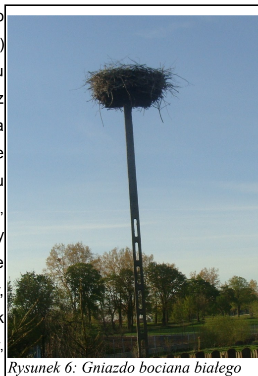
Rysunek 6: Gniazdo bociana białego

Wschodnia część gminy od wsi Smolany po Krusze i dalej Grzebsk, Chmielewo (gm. Wieczfnia) to zachodni fragment ostoi o randze krajowej wielu gatunków ptaków oraz ssaków łownych związana z doliną Orzyca, wymieniana w literaturze jako jedna z ważniejszych ostoi w kraju. Ostoja ta obejmuje górną część doliny Orzyca od jej źródeł aż do mostu na szosie Janowo-Mława. Dolina jest zabagniona, zajmują ją zarośla wierzbowe, trzcinowiska i kępy olszyn. Część doliny użytkowana jest jako łąki kośne pastwiska. W ostoi tej gniazdują m.in. bocian czarny, bocian biały, trzmielojad, błotnik stawowy, błotnik łąkowy, orlik krzykliwy, cietrzew, derkacz, żuraw, rycyk.