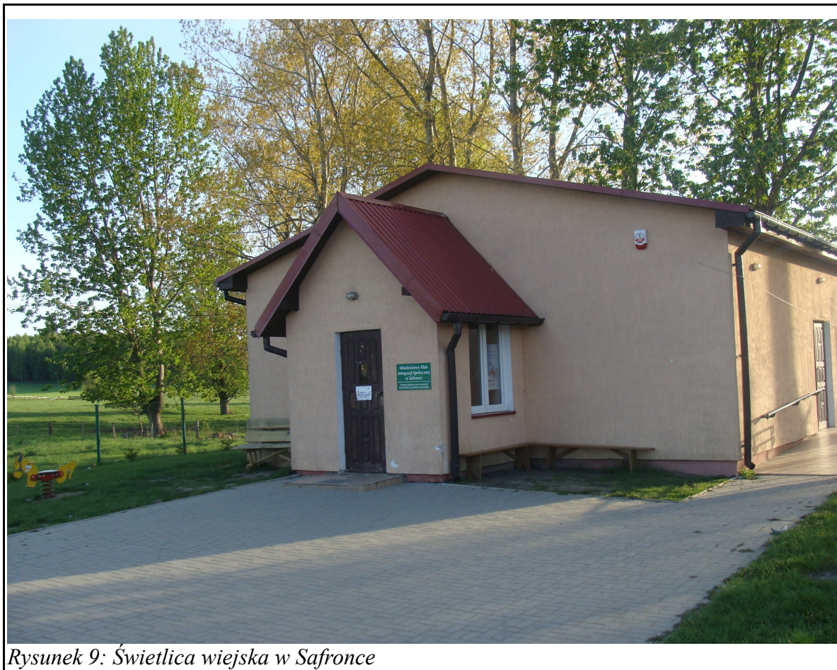
Rysunek 9: Świątelnia wiejska w Safronce