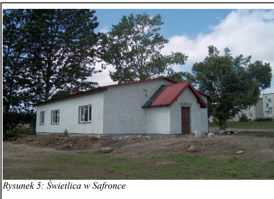
Rysunek 5: Świetlica w Safronce

Poza tym jej działalność polega na organizowaniu wolnego czasu dla dzieci i młodzieży.