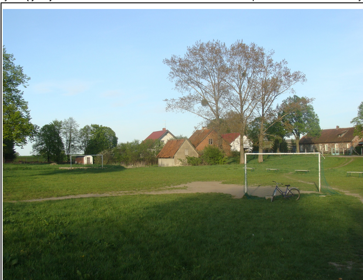
Rysunek 8: Boisko do gry w piłkę nożną.

W sołectwie Safronka nie występują skwery, parki ani ścieżki rowerowe. Atrakcją turystyczną jest jednak nieskażone środowisko naturalne oraz spora ilość lasów w okolicy.