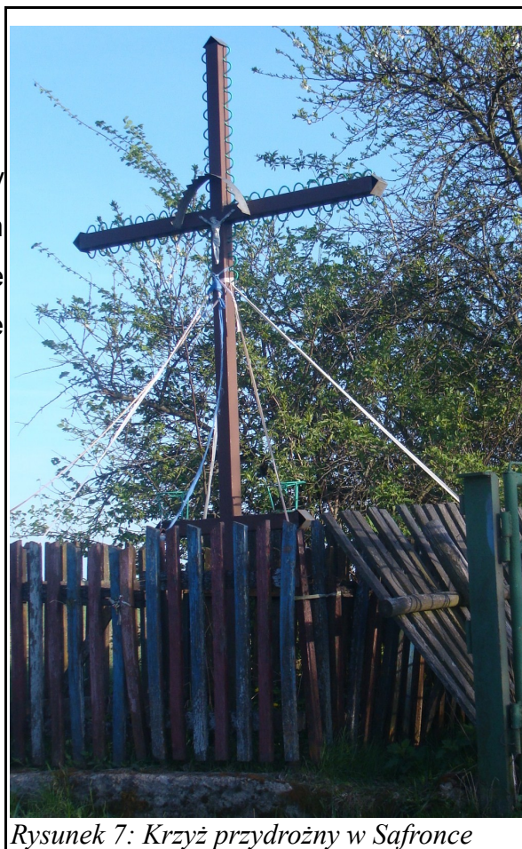
Rysunek 7: Krzyż przydrożny w Safronce