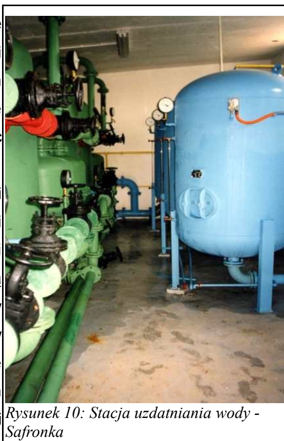
Rysunek 10: Stacja uzdatniania wody - Safronka

Ogromnym problemem wsi Safronka i Wiłunie jest brak kanalizacji. Obecnie ścieki gromadzone są w zbiornikach bezodpływowych i wywożone przez Spółdzielnię Mieszkaniową SAFRONKA na oczyszczalnię ścieków w miejscowości Kuce. Stan zbiorników bezodpływowych jest zły, a wywóz ścieków ze zbiorników przy budynkach mieszkalnych niesystematyczny. Niewywożone ścieki z przepelnionych osadników tworzą rozlewiska lub