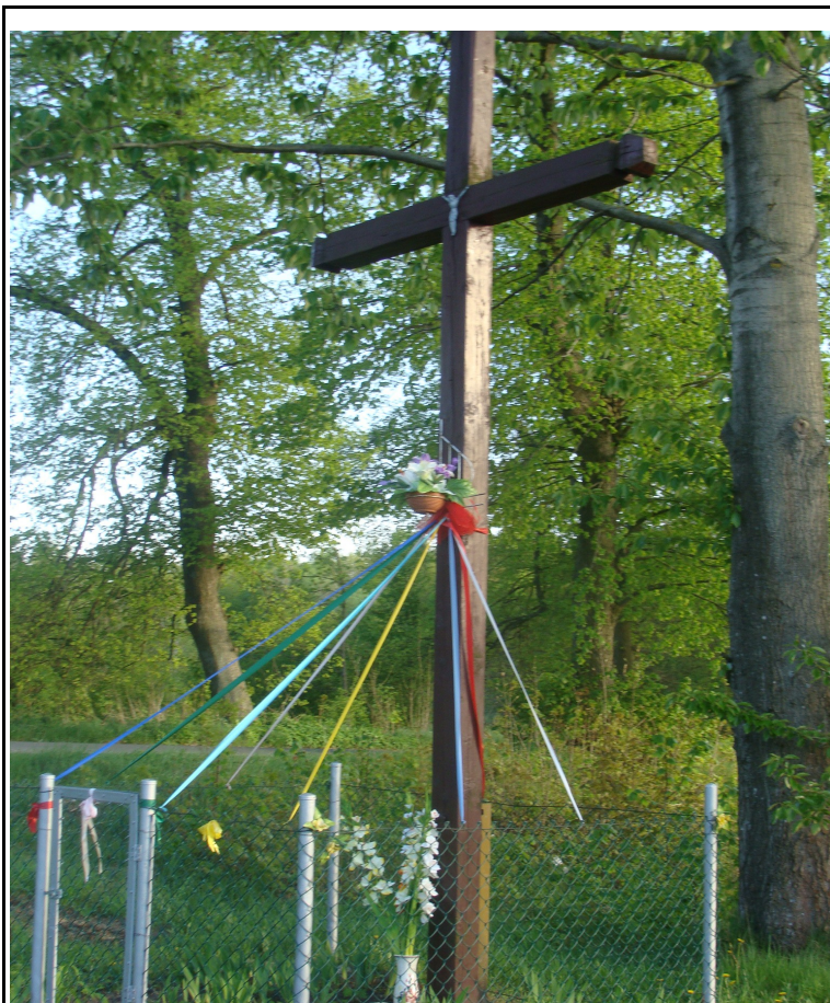
Rysunek 4: Krzyż przydrożny w miejscowości Powierz