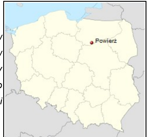
Rysunek 1: Położenie na mapie Polski.

Miejscowość Powierz położona jest w zachodniej części gminy Janowiec Kościelny, w powiecie nidzickim, w odległości ok. 10 km od siedziby gminy (Janowiec Kościelny), 11 km od Nidzicy (miasto powiatowe). Wieś sąsiaduje z innymi miejscowościami gminnymi: Napierki, Wiłunie, Safronka, Gołębie.