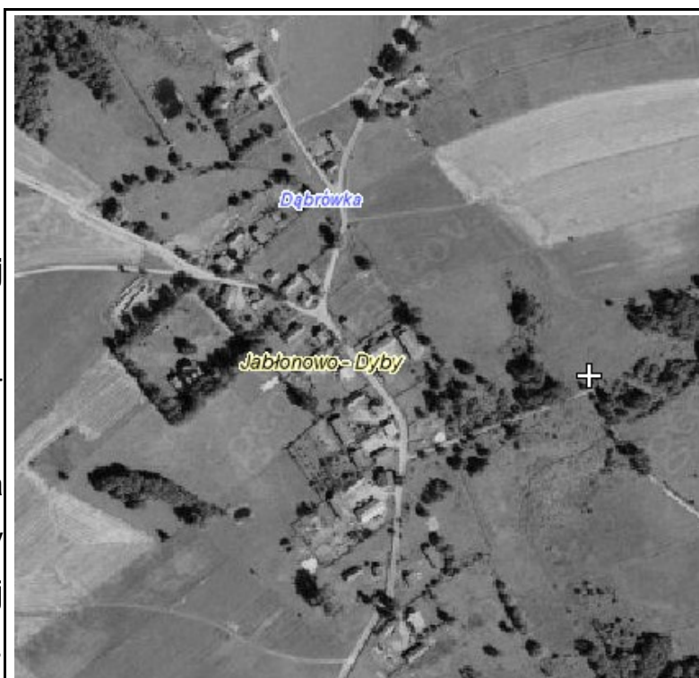
Rysunek 2: Jabłonowo-Dyby

Miejscowości Jabłonowo-Adamy, Jabłonowo-Dyby i Jabłonowo-Maćkowięta posiadają typ zabudowy zagrodowej zwartej, w której przeważają domy jednorodzinne. Zabudowa parterowa