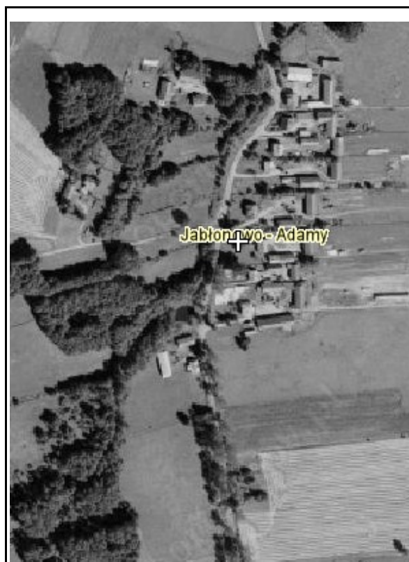
Rysunek 4: Jabłonowo-Adamy