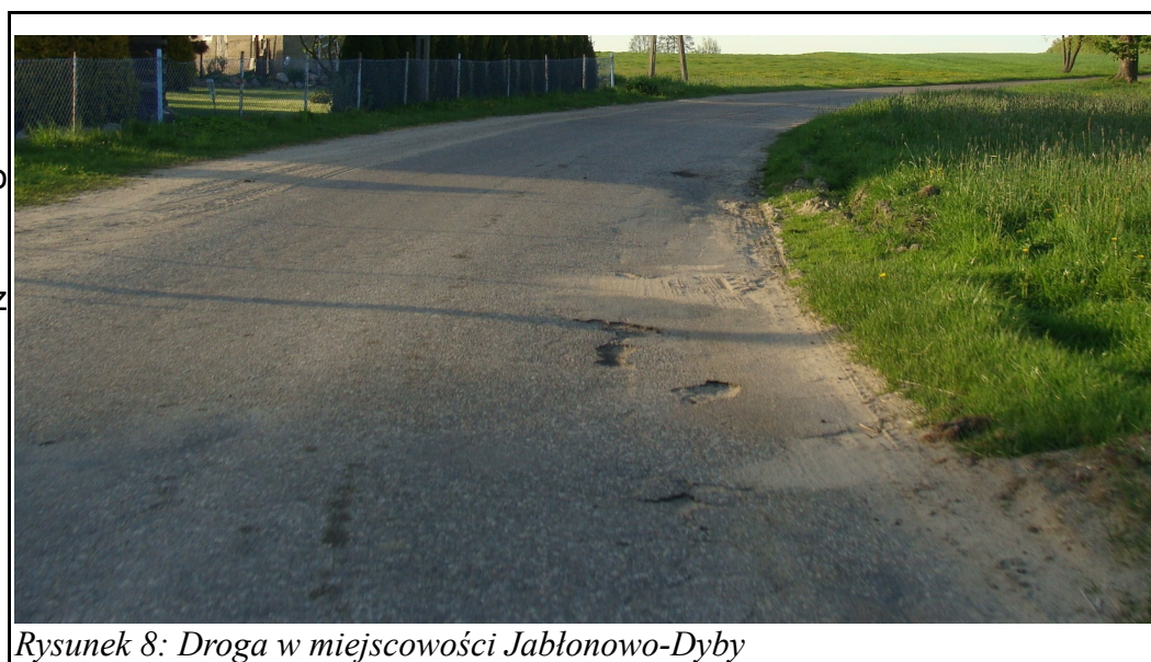
Rysunek 8: Droga w miejscowości Jabłonowo-Dyby

W sołectwie występują także drogi o znaczeniu lokalnym z nawierzchnią żwirową.