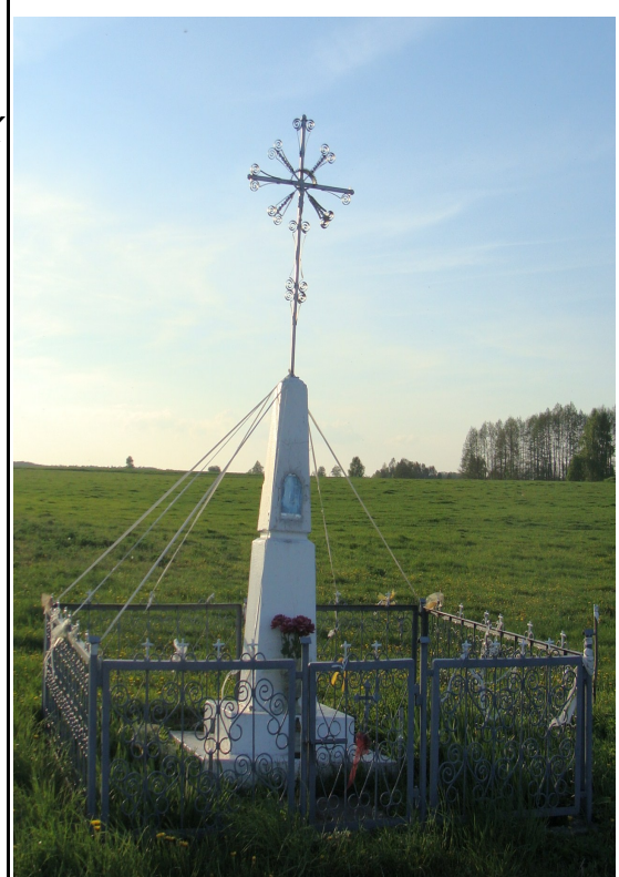
Rysunek 7: Krzyż przydrożny-Jabłonowo-Dyby