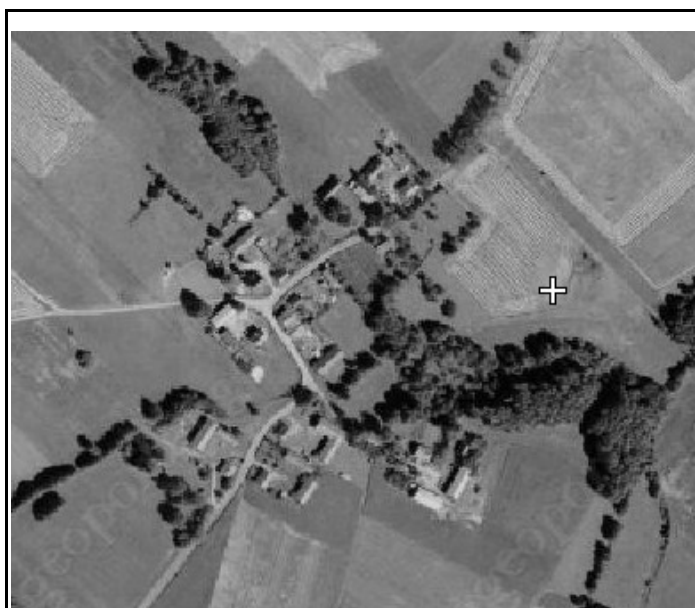
Rysunek 3: Jabłonowo-Maćkowięta

jednopiętrowa, dachy strome, dwuspadowe.