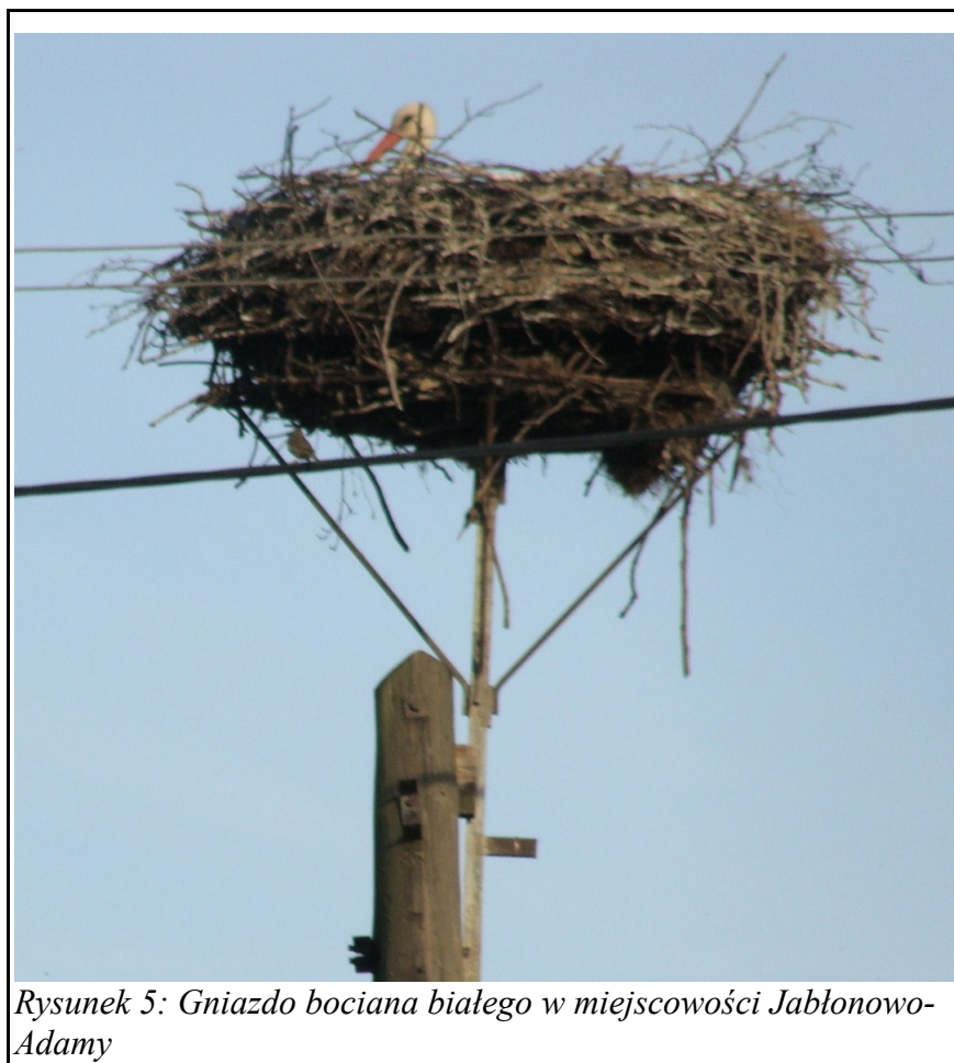
Rysunek 5: Gniazdo bociana białego w miejscowości Jabłonowo-Adamy

Lasy w gminie Janowiec Kościelny zajmują 18,8 % powierzchni. Są to głównie lasy publiczne (61,8%), wśród których 90,3% stanowią lasy państwowe zarządzane przez Nadleśnictwo Nidzica w ramach Regionalnej Dyrekcji Lasów Państwowych w Olsztynie. Dość dużą powierzchnię zajmują lasy prywatne – 37,9% pozostające w znacznym rozdrobnieniu i rozproszeniu.