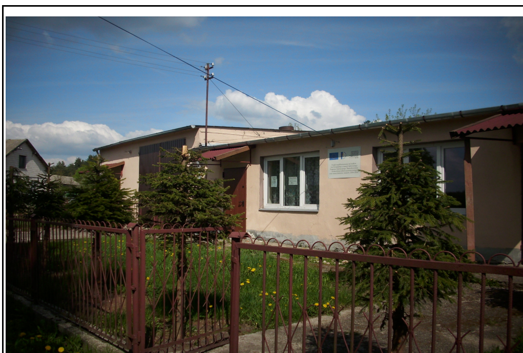
Rysunek 7: Świetlica wiejska w Nowej Wsi Dmochy,

W sołectwie Nowa Wieś Dmochy nie występują skwery, parki ani ścieżki rowerowe. Atrakcją turystyczną jest jednak nieskażone środowisko naturalne. We wsi Nowa Wieś Dmochy znajduje się świetlica wiejska. Wymaga ona jednak remontu. W związku z tym, iż na terenie sołectwa nie ma żadnej instytucji kultury pełni ona ośrodka kulturalnego.