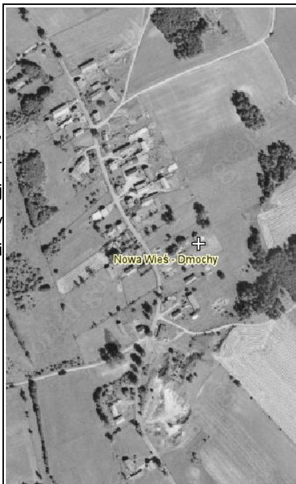
Rysunek 3: Nowa Wieś Dmochy - źródło: geoportal.gov.pl

Miejscowość Nowa Wieś Dmochy, Krajewo Małe, Krajewo Wielkie, Szypułki-Zaskórki posiada typ zabudowy zagrodowej zwartej, w której przeważają domy jednorodzinne. Zabudowa parterowa i jednopiętrowa, dachy strome, dwuspadowe.