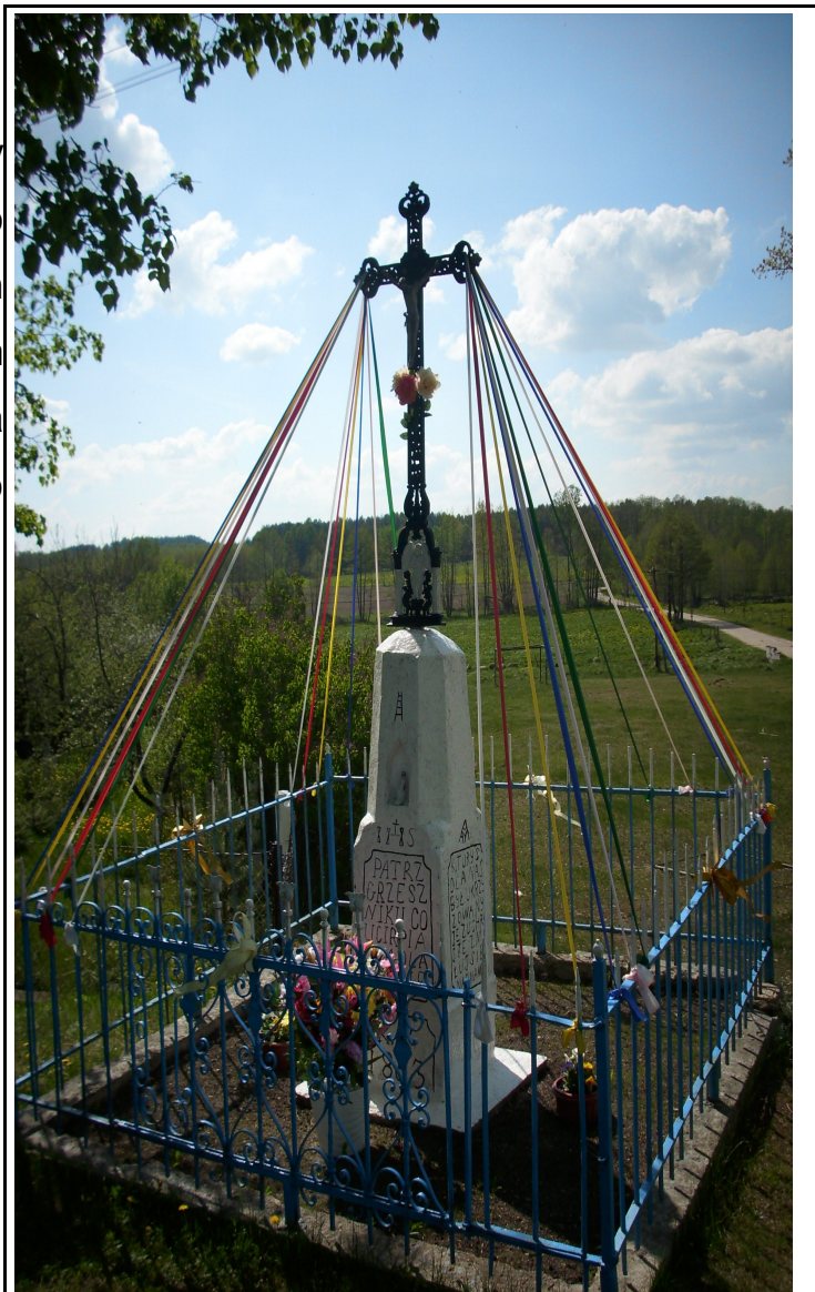
Rysunek 6: Krzyż przydrożny w Nowej Wsi Wielkiej