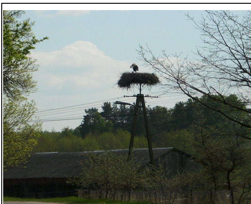
Rysunek 5: Gniazdo bociana białego w Nowej Wsi Dmochy