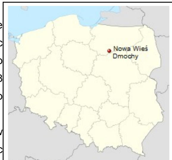
Rysunek 1: Położenie miejscowości na mapie Polski

Nowa Wieś Dmochy znajduje się w odległości ok. 5 km od siedziby gminy (Janowiec Kościelny), ok. 12 km od siedziby powiatu (Nidzica) oraz ok. 65 km od Olsztyna (miasto wojewódzkie).